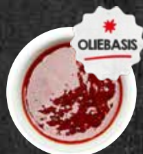
Top Marinade Florida Nieuw