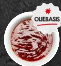
Marinade American BBQ