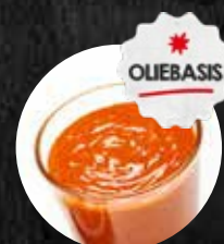
Top Marinade Echalotte Artikelnr: F00220793-01 Inhoud: 2 kg