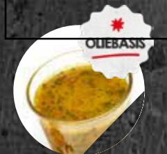
Top Marinade Sweet Thay Artikelnr: F00221212-01 Inhoud: 2 kg