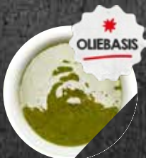
Top Marinade Green Herbs Artikelnr: F00221078-01 Inhoud: 2 kg