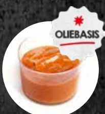
Kruidenolie Athene Artikelnr: F00219323-01 Inhoud: 3 kg