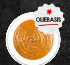
Marinade Dragon Artikelnr: F00221072-01 Inhoud: 2,3 kg