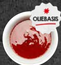
Top Marinade Carne del Sol