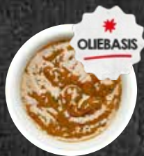
Top Marinade Cocos Curry Artikelnr: F00051556-01 Inhoud: 3 kg