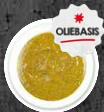
Marinade Toscaans Artikelnr: F00091682-02 Inhoud: 2,3 kg