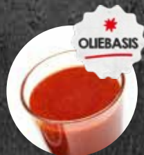
Top Marinade Hot Paprika