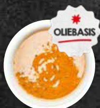
Ajuincreme Artikelnr: F00218929-01 Inhoud: 2 kg