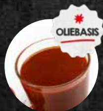
Top Marinade Rood Nieuw