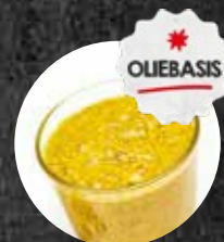
Top Mar. Moutarde à l'ancienne Artikelnr: F00221230-01 Inhoud: 3 kg