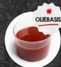
Top Marinade Jairpur