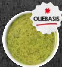
Marinade Bourguignonne Artikelnr: F00090350-02 Inhoud: 2,3 kg