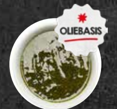
Marinol Krautenbutter Artikelnr: F00219332-01 Inhoud: 3,5 kg