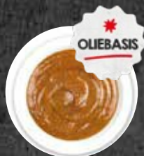
Marinade Shoarma Artikelnr: F00089908-02 Inhoud: 2,3 kg