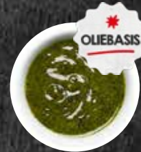
Marinade Groene Kruiden Artikelnr: F00089944-02 Inhoud: 2,3 kg