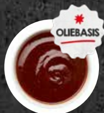
Marinade Argentina Hot