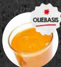
Marinade Forestier Artikelnr: F00219327-01 Inhoud: 3 kg