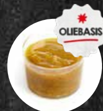
Marinol Singapur Artikelnr: F00219337-01 Inhoud: 3,5 kg