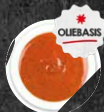
Marinade Smokey BBQ