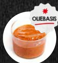
Kruidenolie Knoflook Peper Artikelnr: F00219323-01 Inhoud: 3 kg