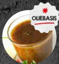
Top Marinade Geel Artikelnr: F00221204-01 Inhoud: 2 kg