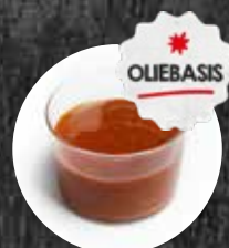
Top Marinade Grill