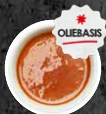
Marifin Pita ZMSG

4 + 1 GRATIS OF 10 + 4 GRATIS BESTEL VOOR 19/3 → LEVERING VANAF 26/3 (eenmalige bestelling)