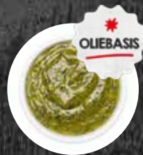
Marinade Dille Mosterd Artikelnr: F00114931-01 Inhoud: 2,3 kg