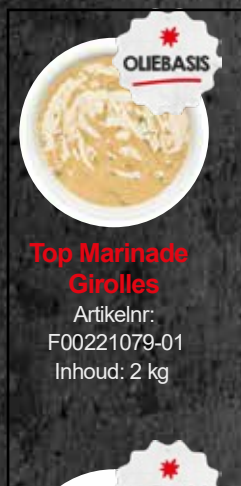
Top Marinade Girolles Artikelnr: F00221079-01 Inhoud: 2 kg

4 + 1 GRATIS OF 10 + 4 GRATIS BESTEL VOOR 19/3 → LEVERING VANAF 26/3 (eenmalige bestelling)