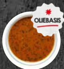
Marinade Indian Herbs