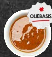
Top Marinade Indian Curry Artikelnr: F00218873-01 Inhoud: 2 kg