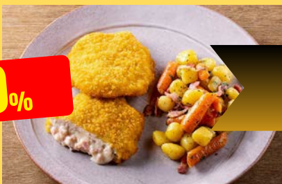
KIP | POULET CORDON BLEU