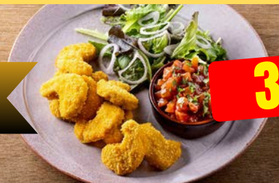
KIP | POULET NUGGETS