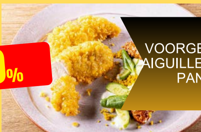
GEPANEERD VOORGEBAKKEN HAASJE AIGUILLETES DE POULET PANÉES PRÉCUITES