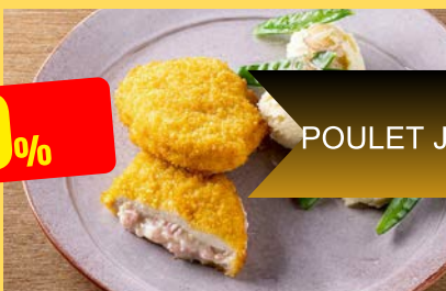
KIP HAM KAAS POULET JAMBON FROMAGE