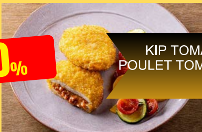
KIP TOMAAT MOZZARELLA POULET TOMATE MOZZARELLA