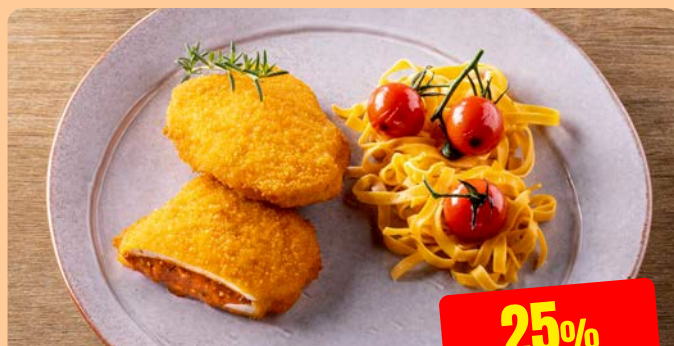
KIPFILET ITALIAANS Maïski 125 g - 3 kg