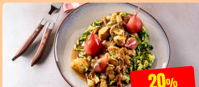
COQ AU VIN Maïski 3 kg