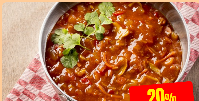
ORIENTAALSE SAUS Maïski 2.3 kg