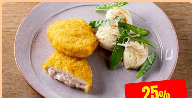
KIPFILET HAM/KAAS Maïski 125 g - 3 kg