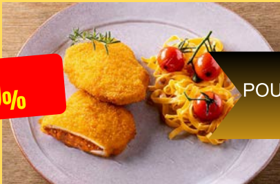
KIP ITALIAANS POULET à L'ITALIENNE