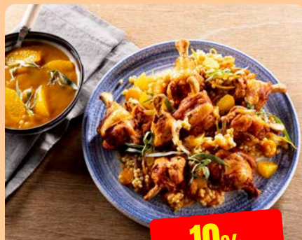
APEROSTICKS Maïski 4 x 500 g