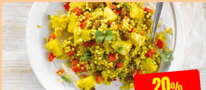
PERELCOUSOUS OP OOSTERSE WIJZE Maïski 2 kg