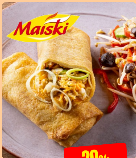
LOEMPJA MET KIP Maïski 7 x 200 g