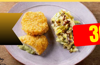
KIP KAAS PREI POULET FROMAGE POIREAU