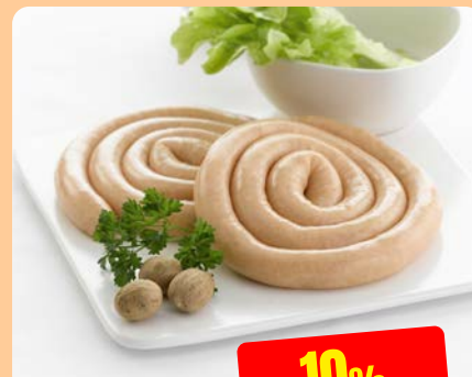
KIPCHIPOLATA Maïski 250 g - 1.5 kg