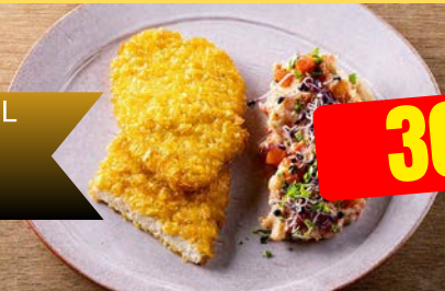
KROKANTSCHNITZEL SCHNITZEL CROUSTILLANT