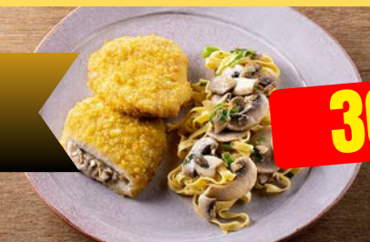
KIP CHAMPIGNONS POULET CHAMPIGNONS