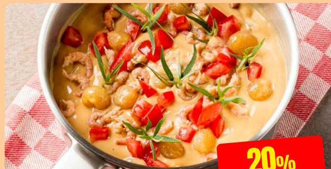
DRUIVENS AUS Maïski 2.3 kg