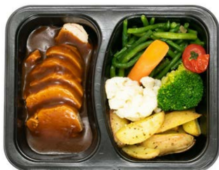
Bressekip met aardappelen en groenten Poulet de Bresse avec légumes et pommes de terre