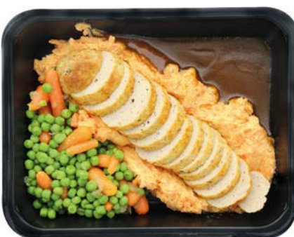
Kippenboomstammetje met wortelen, erwten en puree Buchette de poulet avec petit pois, carottes et purée