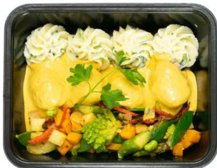
Gehaktballetjes in mosterdsaus met puree Boulettes de haché, sauce moutarde et purée