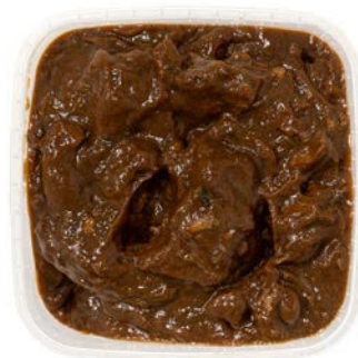
Stoofvlees Ragoût de boeuf