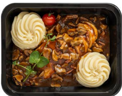
Coq au vin met aardappelpuree Coq au vin et purée de pommes de terre