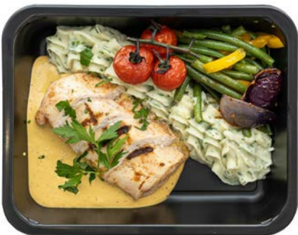
Kipfilet met mosterd saus Filet de poulet à la sauce moutarde