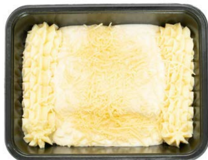
Hamrolletjes witloof in een kaassaus en puree Chicons gratin avec purée