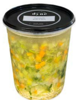
Groentenbouillon soep Potage de bouillon de légumes