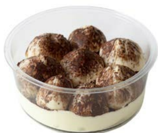
Tiramisu klassiek Tiramisu classique