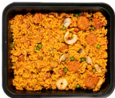
Paella rustica (zeevruchten en chorizo) Paella rustica (mix fruit de mer/chorizo)