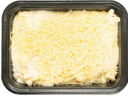
Macaroni met ham in kaassaus Macaroni jambon sauce fromage