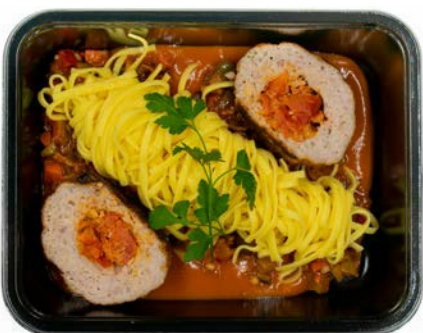
Gehaktbal gevuld met tomaat en mozzarella met pasta Boulette farcie aux tomates et mozzarella avec pâtes