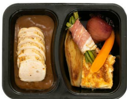
Gevulde Mechelse koekoek, gratin en groentjes Coucou de Malines farci, gratin et légumes