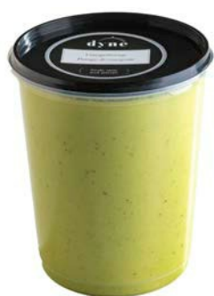
Courgettesoep Potage de courgette