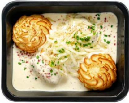
Kabeljauw met mosterdsaus en venkel Cabillaud à la sauce moutarde et fenouil