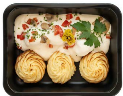
Tongrolletjes pommes duchesse met witte wijnsaus Rouleaux de sole pommes duchesse et sauce au vin blanc