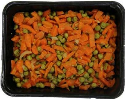
Ertjes en worteltjes gestoofd met ajuin Petits pois et carottes braisés avec oignon