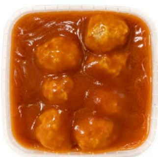
Balletjes in tomatensaus Boulettes sauce tomate