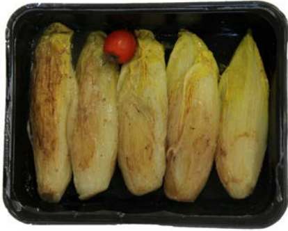
Witloof gestoofd Chicons braisée