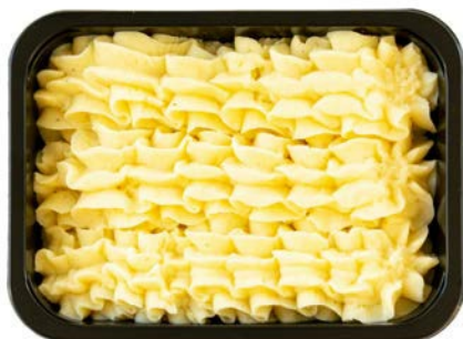
Aardappelpuree Purée de pommes de terre