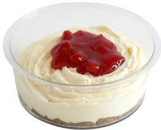
Cheesecake aardbei speculoos Cheesecake à la fraise et au spéculoos