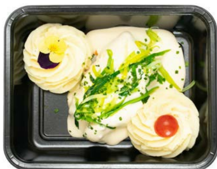
Tongrolletjes gevuld met puree Rouleaux de sole farcis à la purée