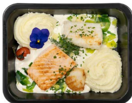
Vispannetje van de chef met coquilles Poêlée de poisson du chef avec coquilles