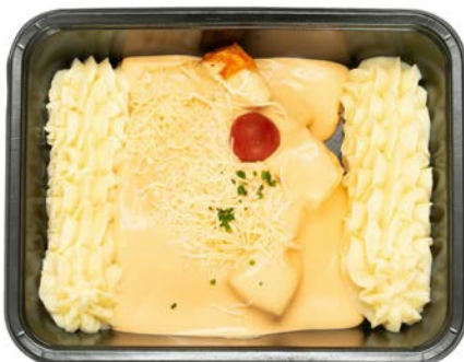
Vispannetje met kreeftensaus Poêlée de poisson sauce au homard