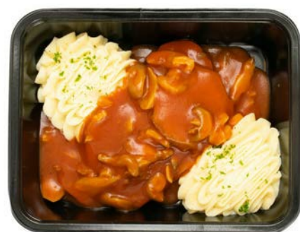
Rundstong in madeirasaus en puree Langue de boeuf au sauce madère et purée