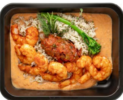
Scampi met romige tomatensaus en bruine rijst Scampi à la sauce tomate crémeuse et riz brun