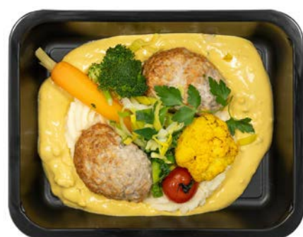
Vleesbroodje in pickelsaus Pain de viande à la sauce pickles