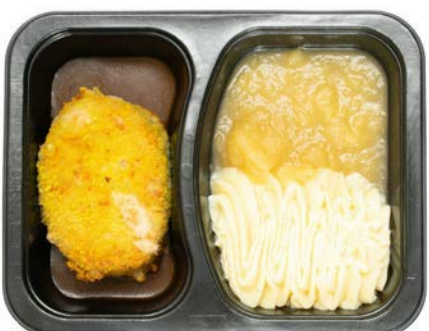
Zwitserse schijf met appelmoes en puree Steak Suisse avec compote de pommes et purée