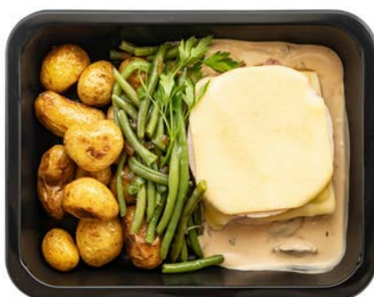
Kippenorlof met archiduc saus Poulet façon Orloff en sauce archiduc