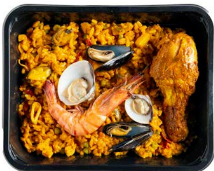
Paella zeevruchten en kip Paella fruit de mer et poulet