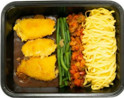
Kippen cordon bleu met ratatouille en tagliatelle Cordon bleu de poulet, ratatouille et tagliatelle