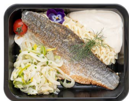
Zeebaars in witte wijnsaus met puree Bar à la sauce au vin blanc avec purée