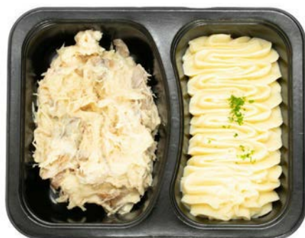
Vol-au-vent met puree Vol-au-vent avec purée