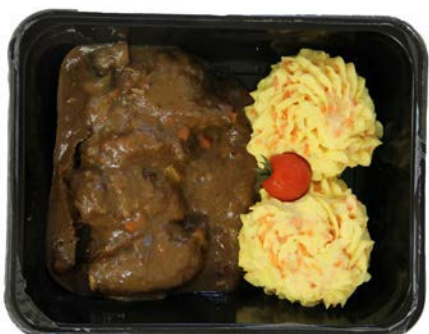
Varkenswangen met wortelpuree Joues de porc avec puree de carottes