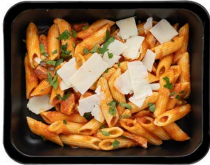
Pasta all'arrabiata Pâtes all'arrabiata