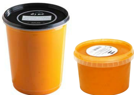
Tomatensoep met balletjes Potage aux tomates et boulettes

U: 010.86.515 F: 2200005 6 x 1 l U: 010.86.527 F: 2200011 6 x 500 ml