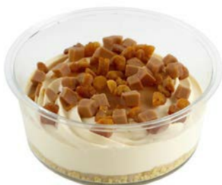
Dulce de lèche met crumble Dulce de lèche avec crumble