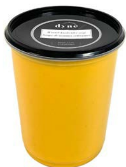
Wortel-knolseldersoep Potage carotte céleri-rave

U: 010.86.515 F: 2200005 6 x 1 l U: 010.86.527 F: 2200011 6 x 500 ml