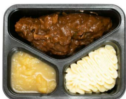
Stoofvlees met appelmoes en puree Carbonade avec compote de pommes et purée