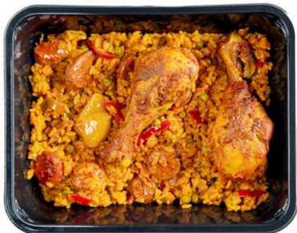
Paella kip en chorizo Paella poulet chorizo