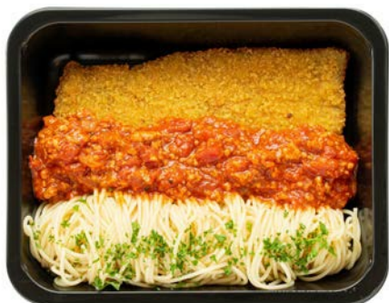
Escalope Milanaise met pasta Escalope Milanaise avec pâtes