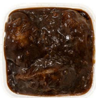
Varkenswangen Joues de porc