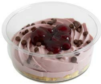
Amarena kersen dessert Dessert cerises Amarena