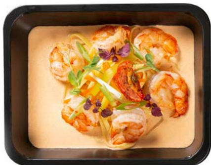
Scampi van de chef met pasta Scampi du chef avec pâtes