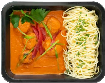
Spaanse kipballetjes met tomatensaus Boulettes de poulet espagnoles à la sauce tomate