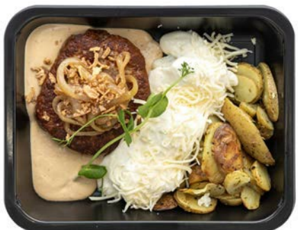
Rundshamburger pepersaus Hamburger de boeuf sauce à la poivre