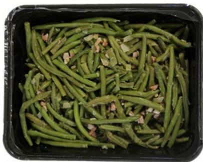
Fijne boontjes gestoofd met spekblokjes en ajuin Haricots fines braisés, lardons et oignon