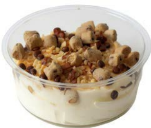
Cookie dough dessert Dessert pâte à cookie