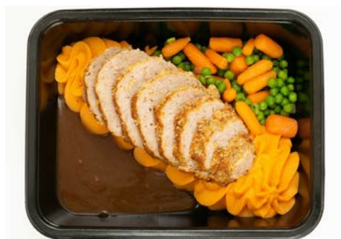
Vleesbrood met erwten, wortelen en puree Pain de viande avec petits pois, carottes et purée