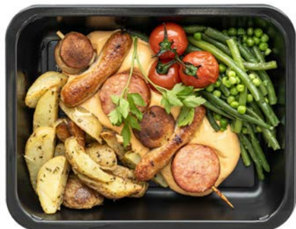
Brochette met aardappelen Brochette avec pommes de terre