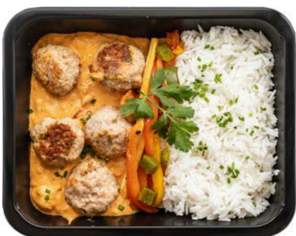
Kippenballetjes in Stroganoffsaus met rijst Boulettes de volaille à la sauce Stroganoff avec riz