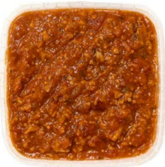
Spaghetti saus Sauce bolognaise