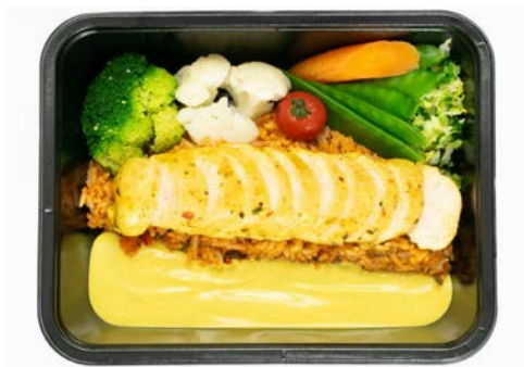
Gemarineerde kip met curry, groentjes en rijst Poulet mariné au sauce curry, légumes et riz