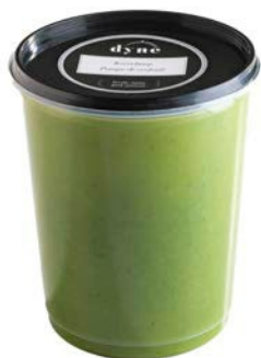
Kervelsoep Potage de cerfeuil