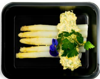
Asperges met hollandaise saus Asperges à la sauce hollandaise