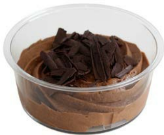
Chocolademousse met chocoladeschilfers Mousse au chocolat avec copeaux de chocolat