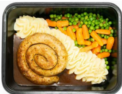
Chipolata met puree, wortelen en erwten Chipolata avec purée, carottes et petits pois