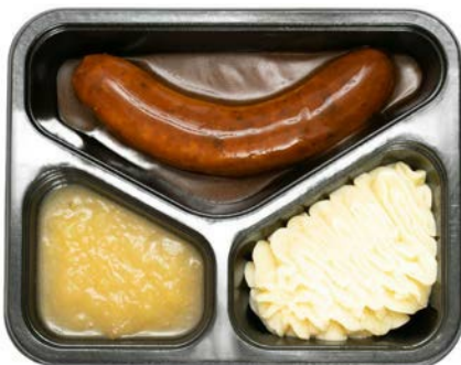
Worst met appelmoes en puree Saucisse avec compote de pommes et purée