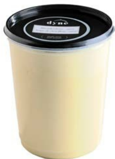
Aspergesoep Potage aux asperges