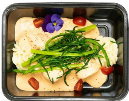
Scharrolletjes met puree Filets de limande à la purée