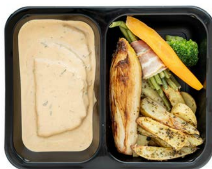
Kalkoenfilet met choronsaus, gebakken aardappelen en groentjes Filet de dinde, sauce choron, pommes de terre cuit & légumes