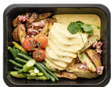
Hoevekip met béarnaise saus Poulet au sauce béarnaise