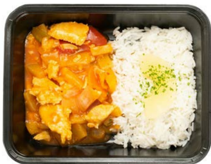
Mexicaanse gewokte kip in zoetzure saus met rijst Wok mexicain de poulet aigre doux et du riz