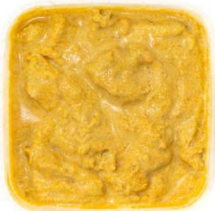
Kip met thaise gele curry Poulet au curry jaune thai