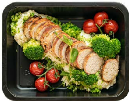
Spekrol met bloemkoolrisotto en broccoli Rouleau de lard avec risotto au chou-fleur et brocoli