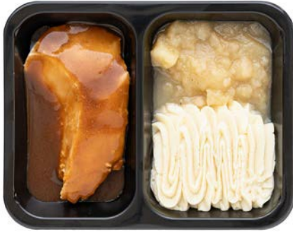
Kipfilet met appelmoes en puree Filet de poulet compote de pommes et purée