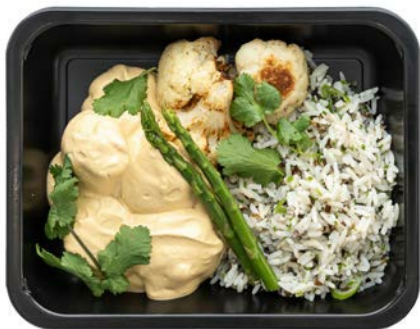
Tongrolletjes met gele currysaus Rouleaux de sole à la sauce curry jaune