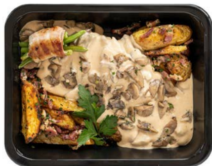
Varkenshaasje archiduc met gebakken aardappelen en spek Filet de porc archiduc pommes de terres et lardons