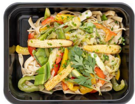
Asian kip met wokgroenten Poulet asiatique aux légumes au wok