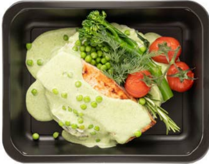
Zalm filet met kruidenpuree Filet de saumon à la purée d'herbes