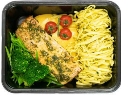
Zalm pesto met tagliatelli Saumon pesto tagliatelli