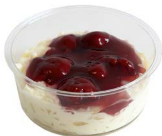
Rijstpap met krieken Riz au lait avec des griottes