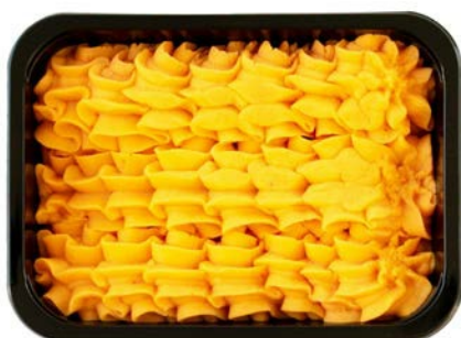
Wortelpuree Purée de carottes