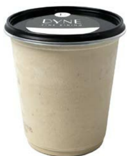
Champignonsoep Potage aux champignons