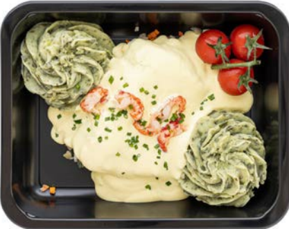
Kabeljauw met blanke botersaus Cabillaud sauce au beurre blanc