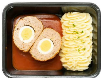
Vogelnestje tomatensaus met puree Nid d'oiseau au sauce tomate avec purée