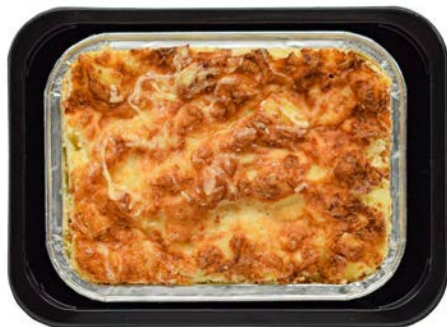
Aardappelgratin van polderaardappelen Gratin dauphinois