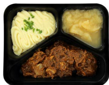
Stoofpotje van konijn met appelmoes en puree Ragoût de lapin avec compote de pommes et purée