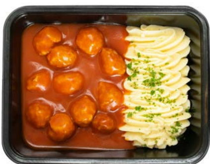
Gehaktballen mini in tomatensaus met puree Mini-boulettes sauce tomate avec purée