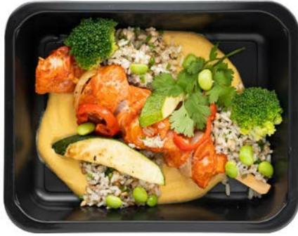
Brochette met bruine rijst en gele curry Brochette au curry avec du riz complet