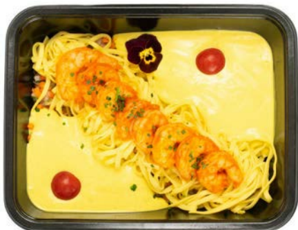
Scampi in zachte currysaus met tagliatelle Scampi sauce au curry doux et tagliatelle