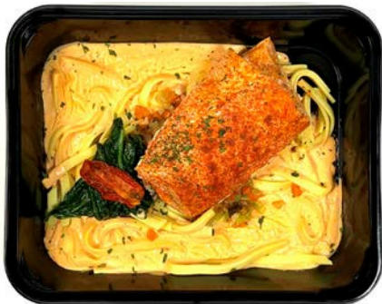
Zalm in sausje van de chef met pasta Saumon à la sauce du chef avec pâtes