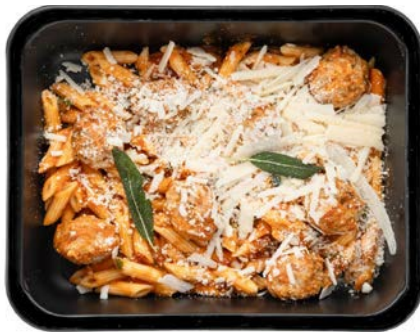
Pasta con polpette Pâtes con polpette