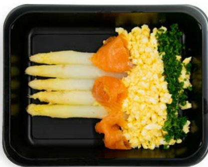
Asperges met gerookte zalm Asperges avec saumon fumé