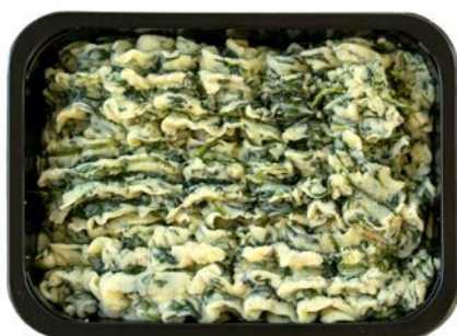
Spinaziepuree Purée d'épinards