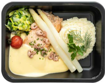
Zalm filet met asperges en botersaus Filet de saumon en sauce au beurre avec asperges