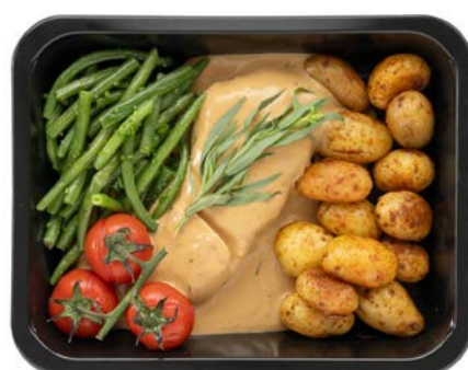
Polderkip met dragonsaus en groene boontjes Poulet des Polders à la sauce estragon et haricots verts