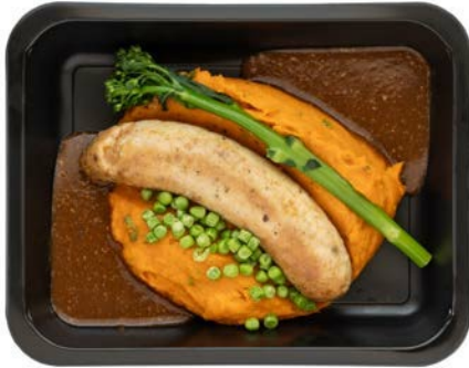
Kippenworst met zoete aardappelpuree Saucisse de poulet avec purée de patates douces