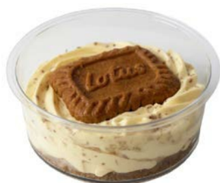
Tiramisu met speculoos Tiramisu au spéculoos