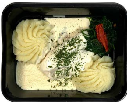
Kabeljauw met witte wijnsaus, spinazie en puree Filet de cabillaud à la sauce vin blanc, épinards et purée