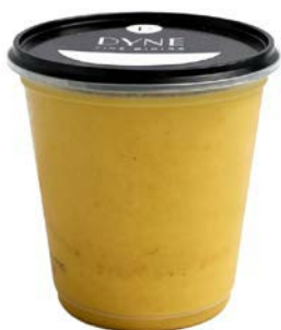
Butternut soep Potage de butternut