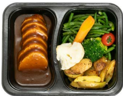
Varkenshaasje aardappelen en groentjes Filet de porc aux pommes de terre et légumes