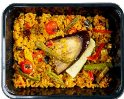
Paella vegetarisch Paella végétarienne